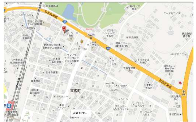
（訓練実施場所）矢板市勤労青少年ホーム