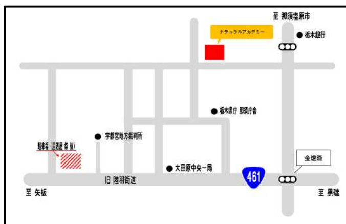
(訓練実施場所) NPO 法人ナチュラル ナチュラルアカデミー TEL:0287-24-0990