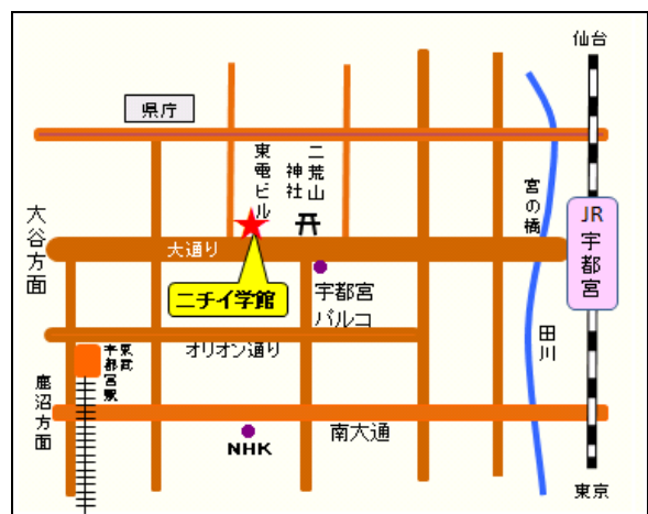
(訓練実施場所) 株式会社ニチイ学館 宇都宮校 TEL: 028-624-2386