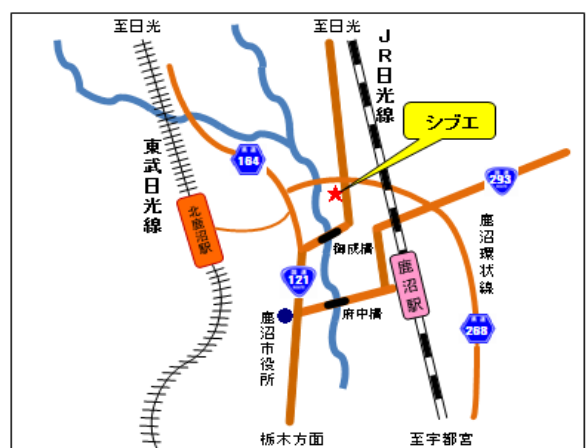
(訓練実施場所)株式会社シブエ パソコンテストセンター TEL:0289-62-8585