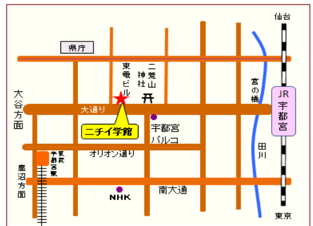
(訓練実施場所) (株)ニチイ学館 宇都宮校