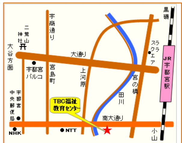
(訓練実施場所) 株式会社TBC福祉教育センター