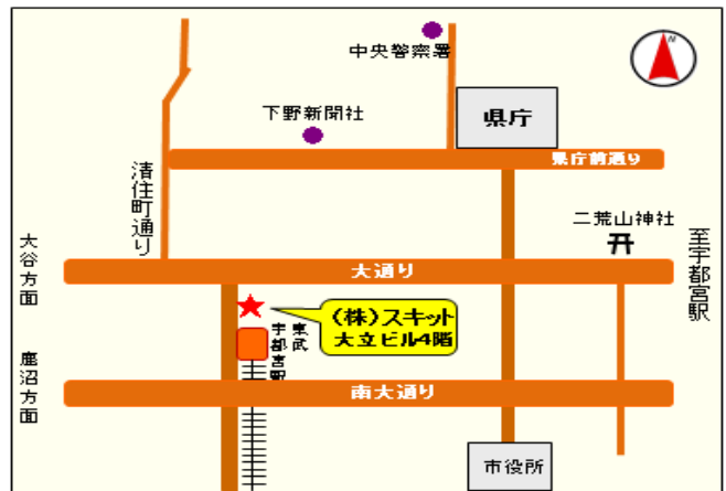
(訓練実施場所) 株式会社スキット TEL:028-612-1141