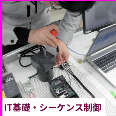
IT基礎・シーケンス制御