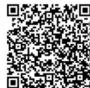
栃木県電子申請システム 二次元コード

詳しい入力方法・納付方法を県央産業技術専門学校のホームページ（入試案内/募集要項）に掲載しています。